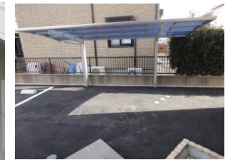
駐輪場スペース有り