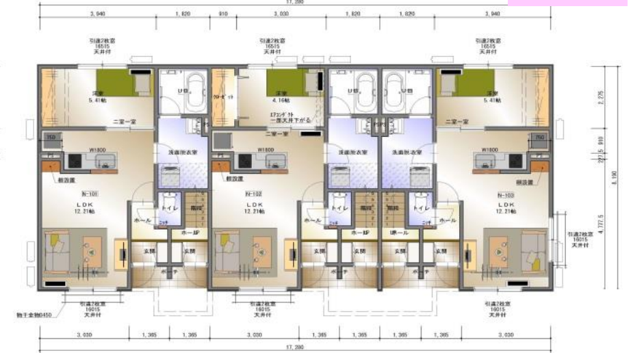
104号室 105号室 106号室 1階平面図