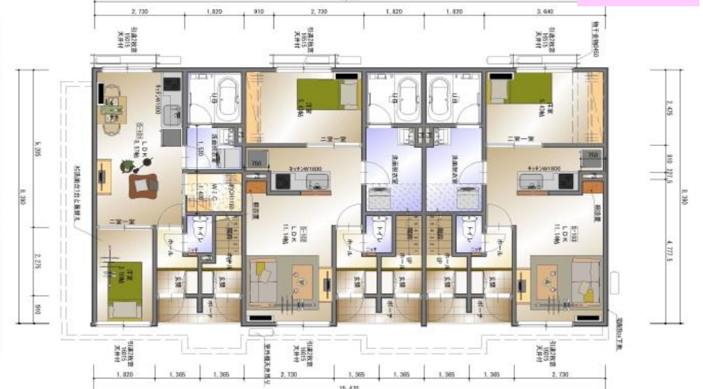
101号室 102号室 103号室 1階平面図

○完成前につき先行申込をされる場合は完成後に必ずご内覧をお願いいたします。 物件資料・概要と内容が異なる場合がございます。現況と優先となります。 ○ご内覧をせずにお申込をされる場合は、お客様の自己責任となります。雰囲気 が違った、想像していたものと違ったとの理由での申込、契約のキャンセルは 不可です。 ○駐車場については都度ご相談ください。