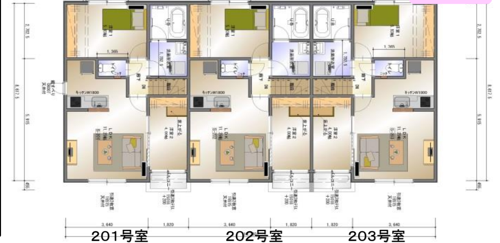
201号室 202号室 203号室 2階平面図