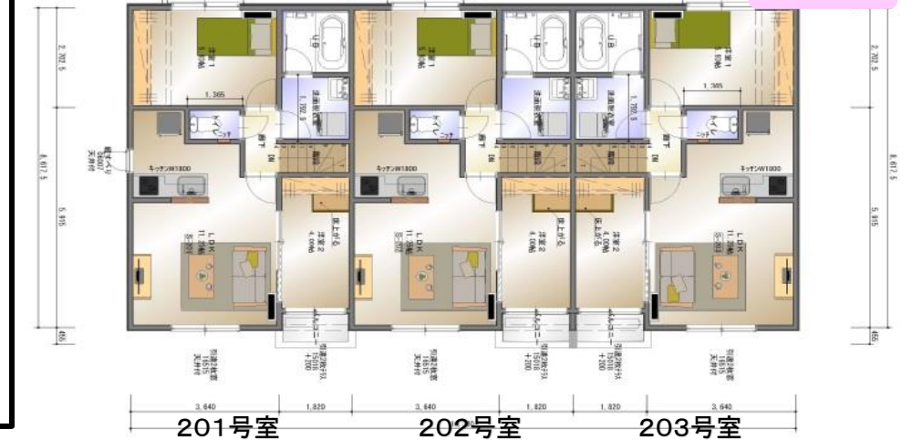
201号室 202号室 203号室 2階平面図