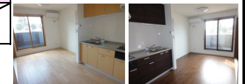
お部屋によって内装の色が異なります是非一度ご内覧ください♪

コンビニまで車で約3分 フレッセイまで車で3分 東京福祉大学まで自転車で約10分 公園まで徒歩3分 バス停(市民プラザ)まで徒歩5分 JR高崎線 本庄駅まで車で10分