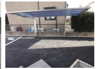
駐輪場スペース有り