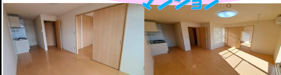
B102号室(反転タイプ)・A303号室