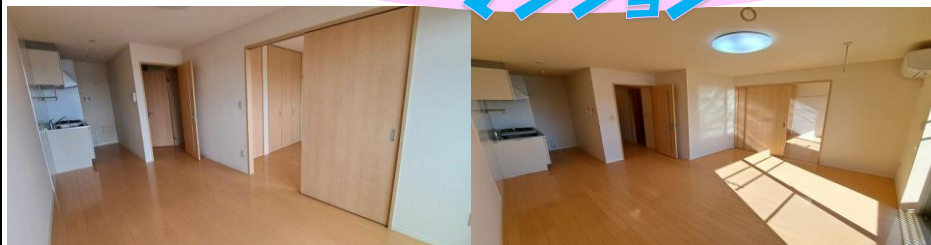
B102号室(反転タイプ)・A303号室