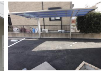
駐輪場スペース有り