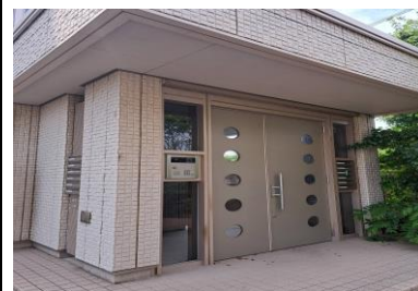
エントランスオートロック